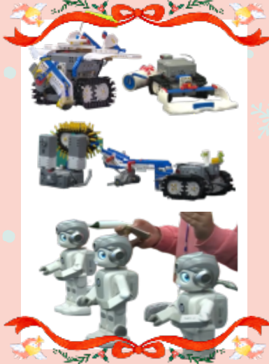
2단계-Ukit & 알파미니